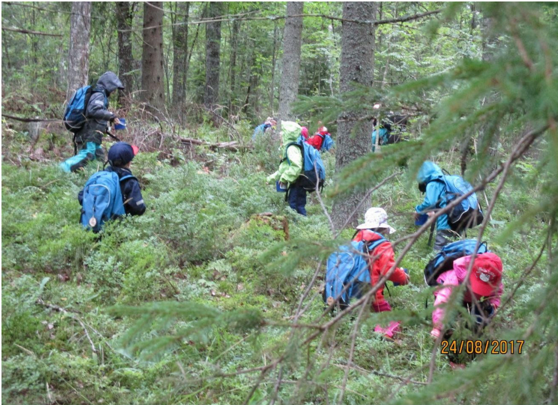
Kuva 2. Metsäretkellä