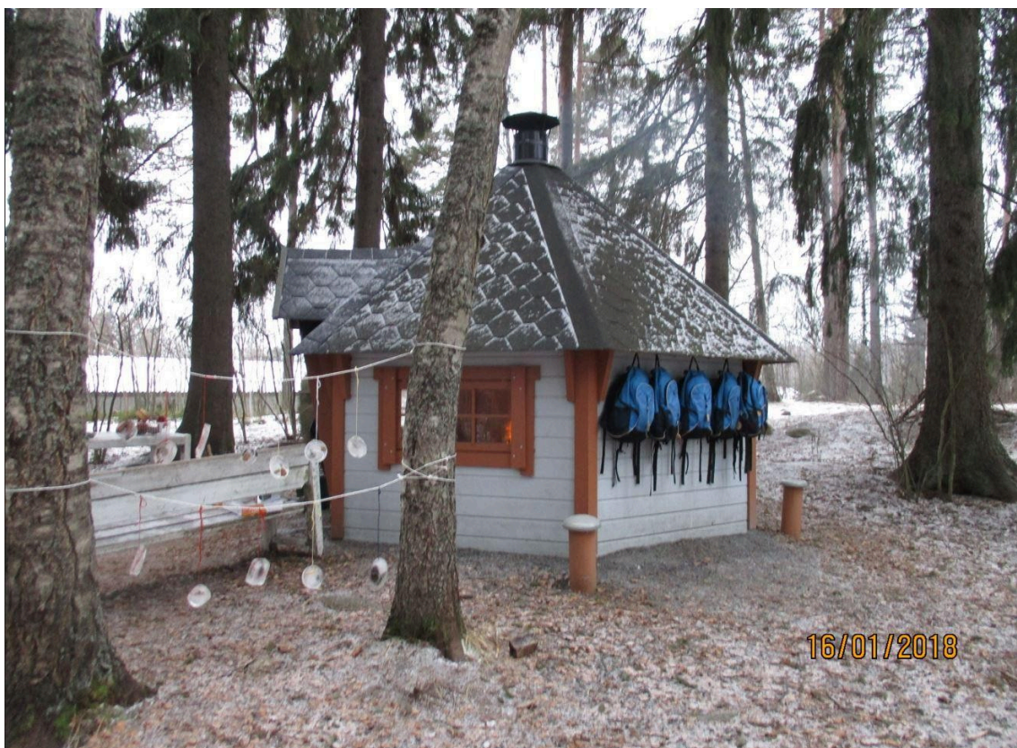
Kuva 1. Luontoesiopetus

nimitystä yksikkökohtainen lukuvuosisuunnitelma. Vuosittaisesta lukuvuosisuunnitelmasta tiedotetaan vanhempainilloissa.