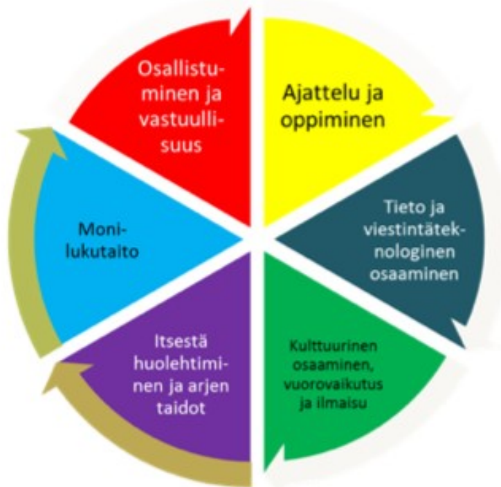
Kaavio 3. Laaja-alainen osaaminen esiopetuksessa