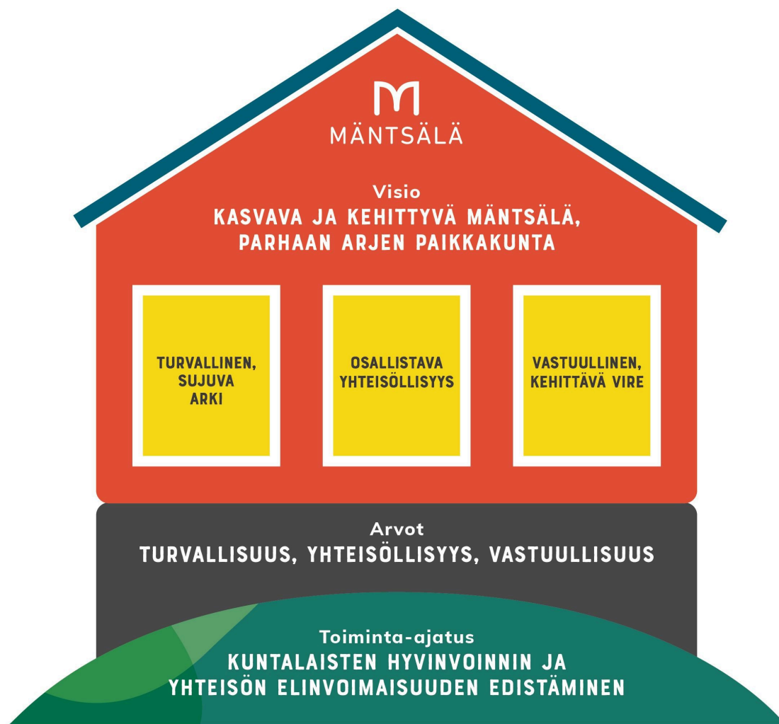
Kaavio 1. Mäntsälän kunnan kuntastrategia ja kärkitavoitteet 2022-2025

uskonnollisesti ja katsomuksellisesti sitouttamaton. Esiopetusta ei saa käyttää kaupallisen vaikuttamisen kanavana.