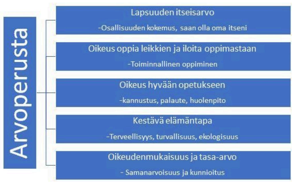
Kaavio 2. Arvoperusta

Esiopetuksen henkilöstö huomioi valtakunnalliset ravitsemus- ja liikuntasuosituksen esiopetuksen arjessa. Lapsia ohjataan terveellisiin elämäntapoihin liittyvissä asioissa. Ekologinen elämäntapa näkyy arjessa esimerkiksi kierrättämisen opettamisen kautta. Mäntsälän esiopetuksessa tuetaan lapsen luontosuhdetta.