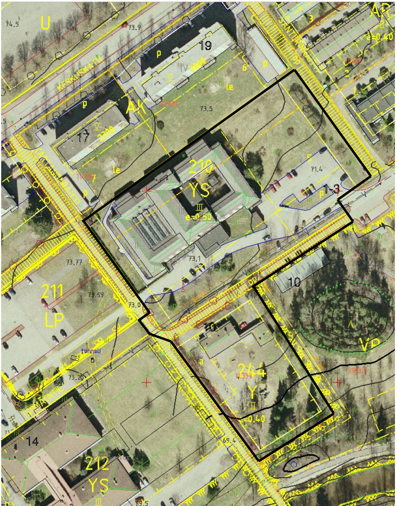
Liite 3. Asemakaava-alue ilmakuvalla